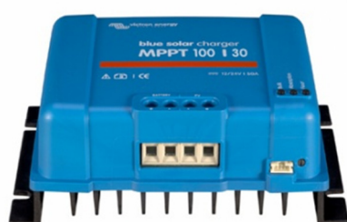
Contrôleur de charge solaire MPPT 100/30