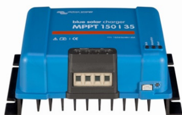
Contrôleur de charge solaire MPPT 150/35