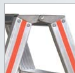
Charnières moulées en fonte d'aluminium haute résistance