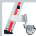
Roulette pivotante avec frein de stationnement