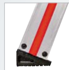
Patins en matière plastique en biais