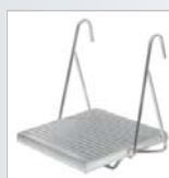
Taquet pose-pieds universel pliant