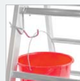
Crochet pour seau pour échelle à échelons