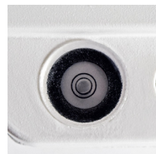
Niveau à bulle