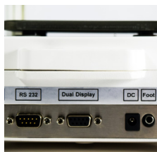
RS232, Dual Display et Foot