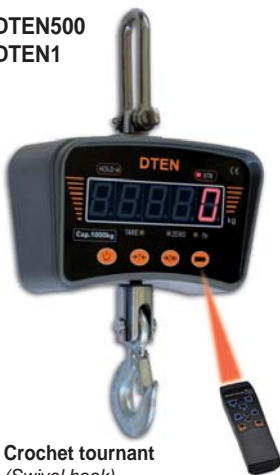
Crochet tournant (Swivel hook)