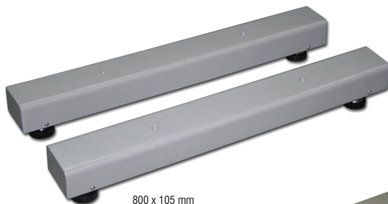
800 x 105 mm